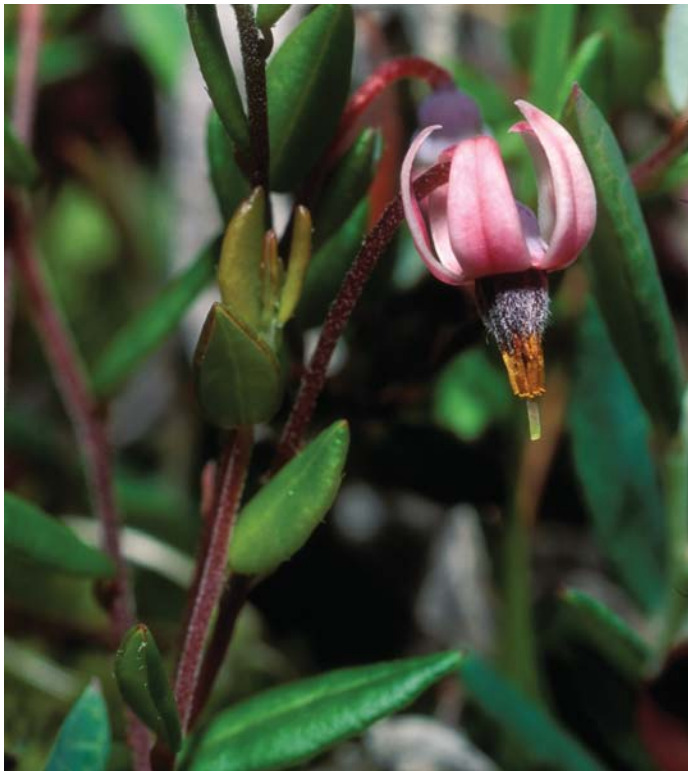
Dlakava mahovnica je pritlikav grmiček s plazečimi, nežnimi vejicami. Plodovi so užitne kisle rdeče jagode.

Natura 2000 je ekološko omrežje, ki se postopoma razvija v vseh državah Evropske unije. Vanj so vključena vsa območja, ki so pomembna za ohranjanje ogroženih rastlin, živali in njihovih življenjskih okolij.