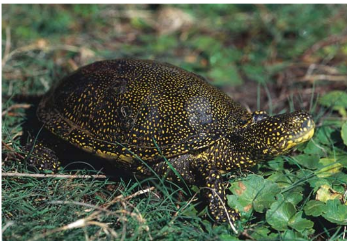
Ob spodnjem toku Temenice biva ena pomembnejših dolenjskih populacij močvirske sklednice.

Močvirska sklednica je edina slovenska domorodna sladkovodna želva. Zaradi uničevanja močvirij je vse bolj ogrožena. Je zelo plašna, saj se ob nevarnosti takoj skrrije v vodo. Aktivna je od aprila do oktobra, prezimi zarita v vodni mulj. Pari se maja, jajca odlaga v peščeno zemljo, mladiči pa se zvalijo avgusta. Hrani se s paglavci, manjšimi ribami in žuželkami. Živi tudi do sto dvajset let.