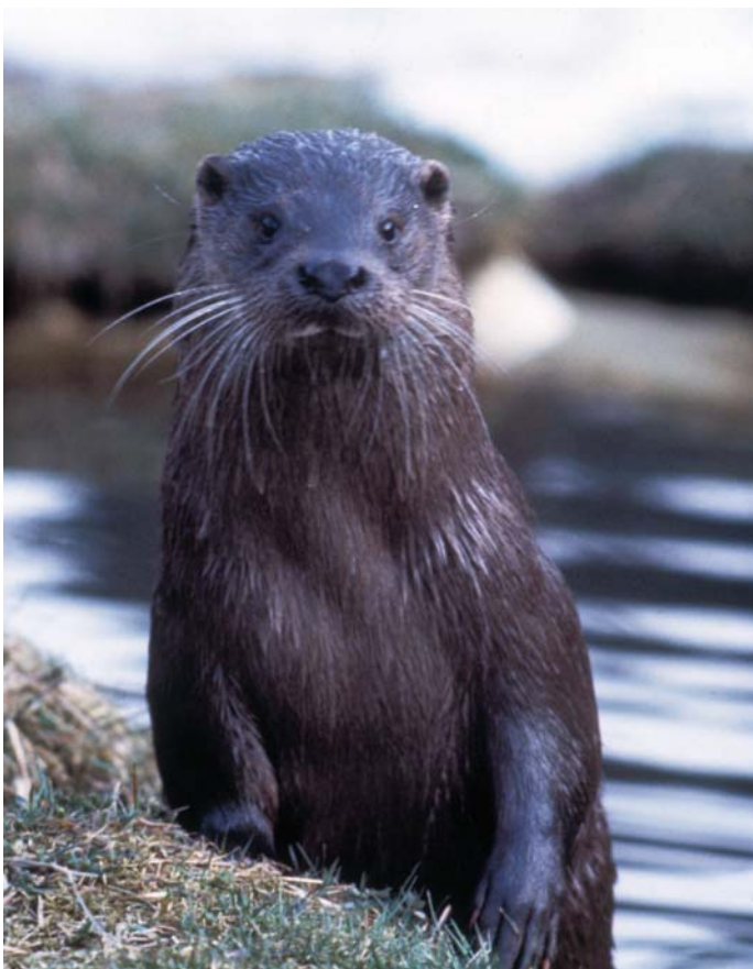
Vidra je v Krki stalno prisotna, v Temenici pa se prehranjuje.

Vidra je eden najbolj ogroženih evropskih sesalcev. V Sloveniji si je njena populacija opomogla po letu 1973, ko je bil lov nanjo ukinjen. Dejavna je ponoči. Je samotarska žival in se družijo le v času parjenja. Ozemlje, ki si ga lasti, obsega do nekaj 10 km vodnih obrežij, označuje pa ga z iztrebki. Hrani se predvsem z ribami.