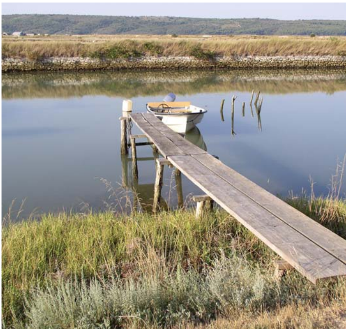
Morje se nemoteno pretaka pod lesenimi brvmi in obliva slanoljubno družčino rastlin.