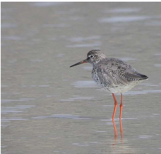
Plitvina ob izlivu kanala v morje je zaradi stalnega dotoka morske vode bogata s hrano in je zato raj za ptice - tudi za rdečenogega martinca.

V Kanalu Sv. Jerneja ljudje že stoletja privezujejo barke. Ohranjena obala ter pester rastlinski in živalski svet so dokaz, da ljudje to od nekdanj počnejo z veliko mero odgovornosti in spoštovanja do narave.