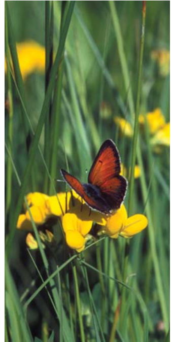
Mochvirski cekinček je eden najbolj ogroženih metuljev pri nas.