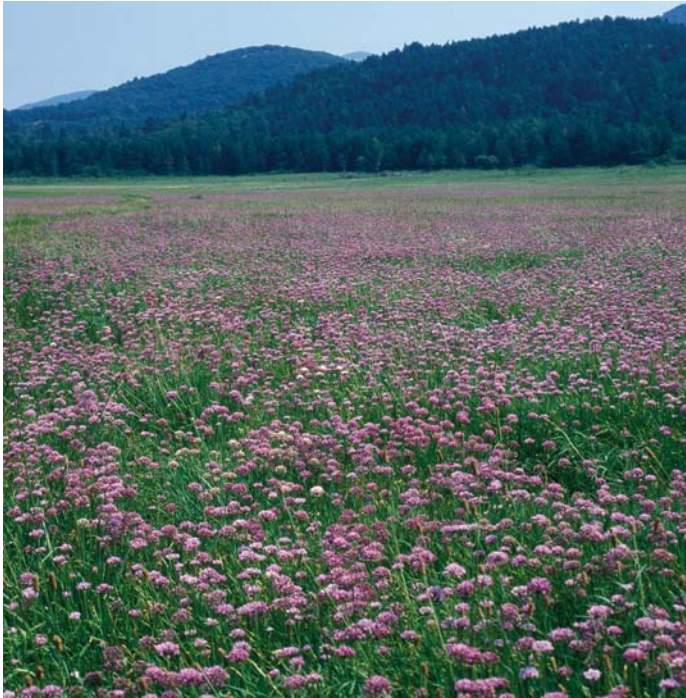
Presihajoča jezera v dolini Pivke so zakladnica rastlinskih in živalskih vrst.

Natura 2000 je ekološko omrežje, ki postopoma nastaja v vseh državah Evropske unije. Vanj so vključena območja, ki so pomembna za ohranjanje ogroženih rastlin, živali in njihovih življenjskih okolij.