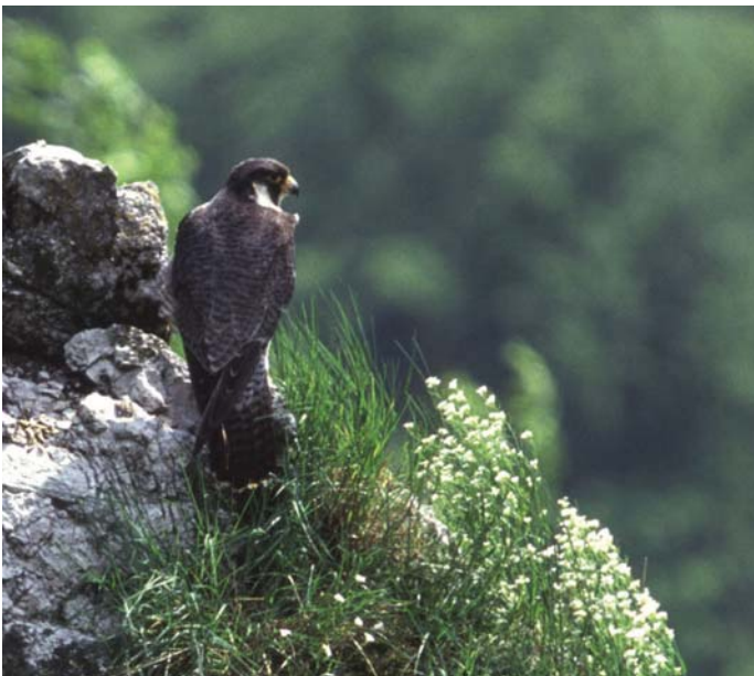
Če sokola selca pri gnezdenju nihče ne moti, se leto za letom vrača na isto mesto.

V Posavskem hribovju ga moti predvsem prisotnost človeka v bližini gnezd.