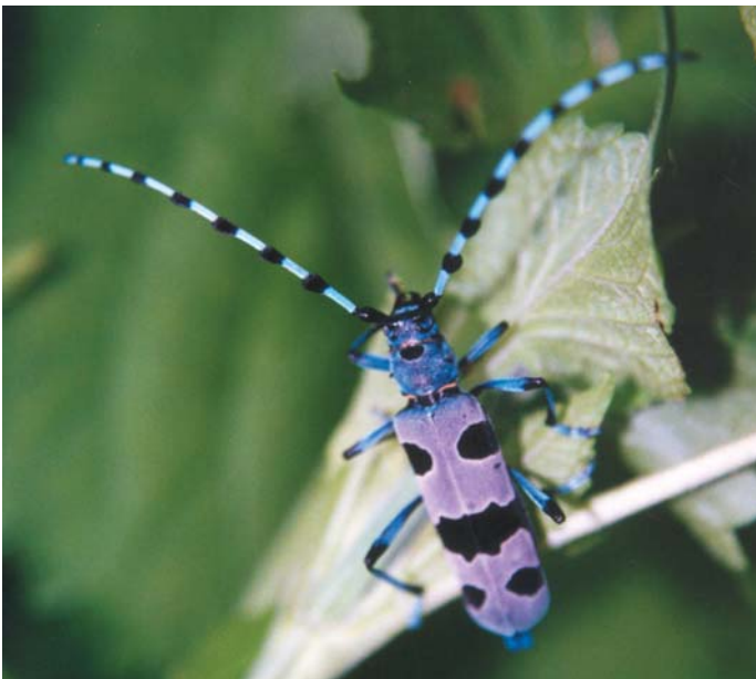
Samico alpskega kozlička privablja vonj sveže posekanega bukovega lesa.

Razvoj ličinke traja kar tri do štiri leta.