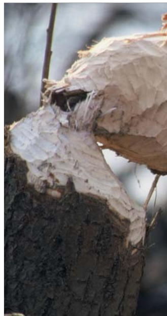
Vrbe imajo pri prehrani bobra bistven pomen.