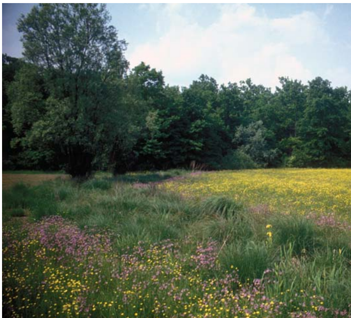
Mozaik ekstenzivnih travnikov je ključen za preživetje ogroženih rastlinskih in živalskih vrst.

Natura 2000 je ekološko omrežje, ki postopoma nastaja v vseh državah Evropske unije. Vanj so vključena območja, ki so pomembna za ohranjanje ogroženih rastlin, živali in njihovih življenjskih okolij.