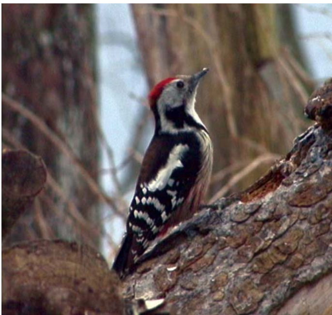
Srednji detel v Dobravi gnezdi aprila in maja, zato ga takrat ne motimo..

Prepoznavni so po živo rdeče obarvanem perju na temenu. Njihovo prisotnost izdaja značilno oglašanje, trkanje po suhih deblih, in številna dupla na hrastovih deblih.