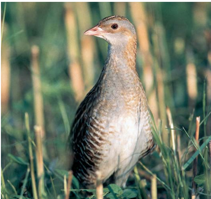
Kosec je svetovno ogrožena vrsta.

Kosec je skrivnostna travniška ptica, ki večino časa preživi v kritju gostega travniškega rastja, tako da ga lahko le redko vidimo. Njegovo prisotnost izdaja razpoznavno oglašanje, raskavi dvozložni klic »krrek-krrek«, ki v spomladanskih in poletnih nočeh odmeva prek travnikov. Koščeva pesem nekoliko spominja na zvok ob brušenju kose, od tod tudi njegovo ime.