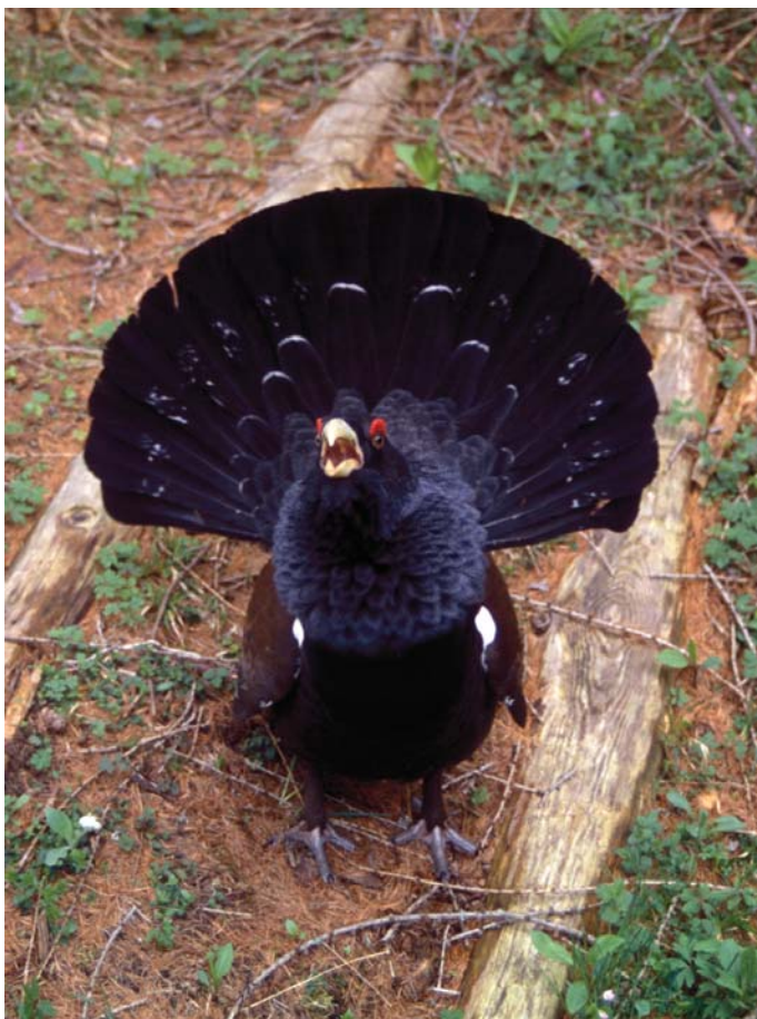
Divji petelin med snubljenjem.

V času parjenja in gnezdenja divjega petelina ogroža nemir v gozdu. Ker se njegov življenjski prostor nenehno krči, je na seznamu zavarovanih živali.