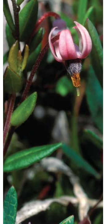
Dlakava mahovnica in okroglosti rosika uspevata na barjanskih tleh.