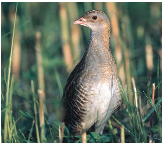
V dolini Reke gnezdi 30-61 parov koscev. Ogroža jih predvsem prezgodnja in velikopovršinska mehanizirana košnja.

Kosec večino časa preživi v kritju gostega travniškega rastja. Je prebivalec nižinskih vlažnih travnikov, pa tudi gorskih travišč. Čeprav ni ravno droben - velik je kot grlica - živi tako skrito, da ga človek skoraj nikoli ne vidi. Dosti bolj razpoznavna je koščeva pesem, raskav dvozložen klic »krrek-krrek«. Klic nekoliko spominja na zvok ob brušenju kose, od tod ime kosec. Prehranjuje se s polži, deževniki, žuželkami, jeseni pa tudi s semeni trav in šašev.