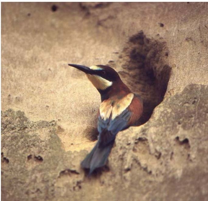
Čebelar si je gnezdišča vkopal tudi v peščene erodirane bregove Reke.

Je zelo živo obarvana ptica, ki jo navadno srečamo v jatah. Po trebuhu, perutih in repu je svetlo modre barve, pod kljunom je rumena, po glavi in hrbtu pa opečno rjava. Kot že ime pove, se v glavnem hrani z divjimi čebelami, pogosto pa tudi z osami, sršeni in kačjimi pastirji, ki jih z neverjetno spretnostjo in hitrostjo lovi v zraku. Gnezdi v peščenih stenah ob rekah in peskokopih, v katere si izkoplje gnezdilne rove. V Sloveniji je znanih le nekaj čebelarjevih gnezdišč.