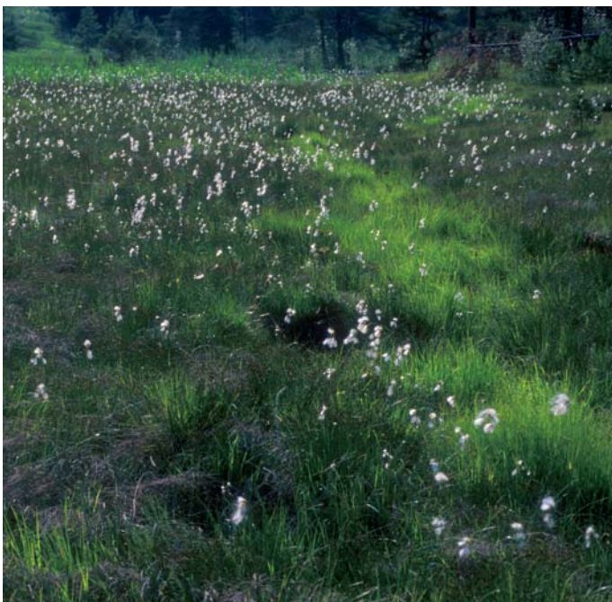
Bele čopke munca na nizkem barju opazimo že od daleč.

Nekoliko dvignjen obvodni svet krasijo cvetoči mokrotni travniki, ki so se ohranili tudi s pomočjo človekovega dela. Danes jih ogroža opuščanje občasne košnje, saj se ponekod že vidno zaraščajo z brezo in rdečim borom.