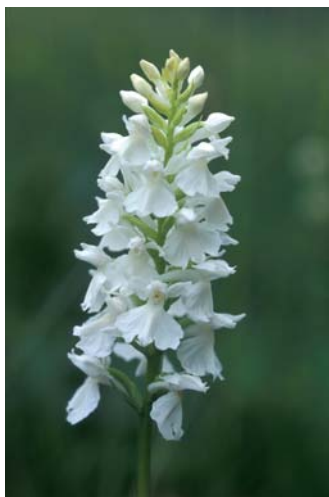
Transsilvansko prstasto kukavico lahko najdemo le redkokje v Sloveniji.

Ob Bloščici domujejo nekatere redke in ogrožene vrste rastlin in živali. Največja botanična zanimivost Bloške planote je drobna orhideja poletna škrbica. Bloke so njeno najpomembnejše nahajališče v Sloveniji. Z nekoliko sreče lahko med sprehodom naletimo tudi na drobni mesojedki malo mešinko in dolgolisto rosiko.