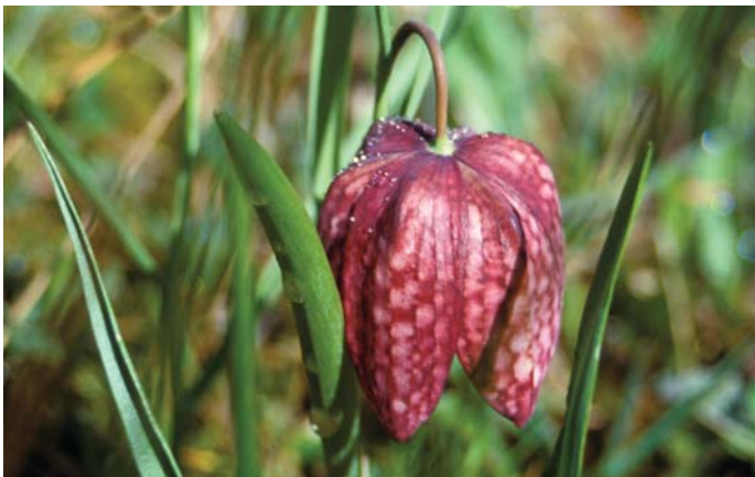
Močvirski meček in močvirska logarica rasteta le na skromno gnojnih in negnojnih travnikih.

barjanski cekinček in strašničn modrin. Ob vodah se spreletavajo bleščeče pisani kačji pastirji, med njimi redki svetlomodri koščični škratec.