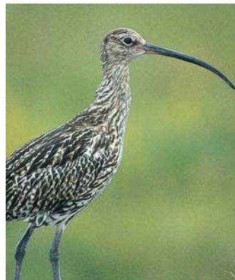
Zadnjih nekaj parov velikega škurha v Sloveniji gnezdi samo še na Ljubljanskem barju.

Na šotnem barju pri Kostanjevici pa še vedno lahko najdemo nekatere predstavnike redkega barjanskega rastlinstva: šotne mahove in rosiko.