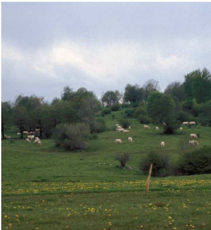
S pašnjo in košnjo se bo zaustavilo zaraščanje travnikov.

Natura 2000 je ekološko omrežje, ki postopoma nastaja v vseh državah Evropske unije. Vanj so vključena območja, ki so pomembna za ohranjanje ogroženih rastlin, živali in njihovih življenjskih okolij.