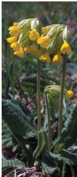
Travniki na Banjšicah očarajo tudi ljubitelje rastlin.