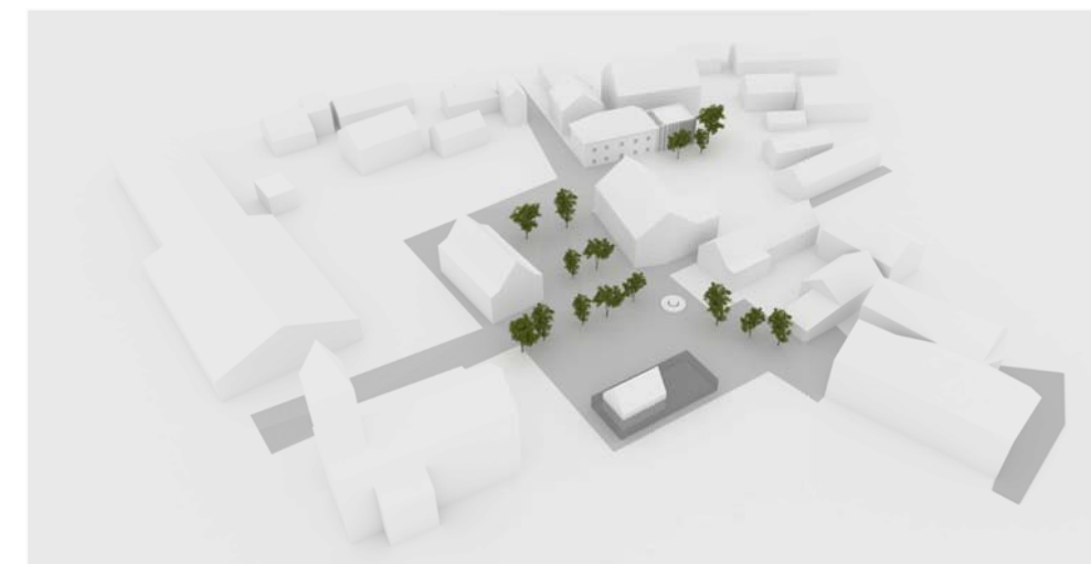
Pogled iz ptičje perspektive