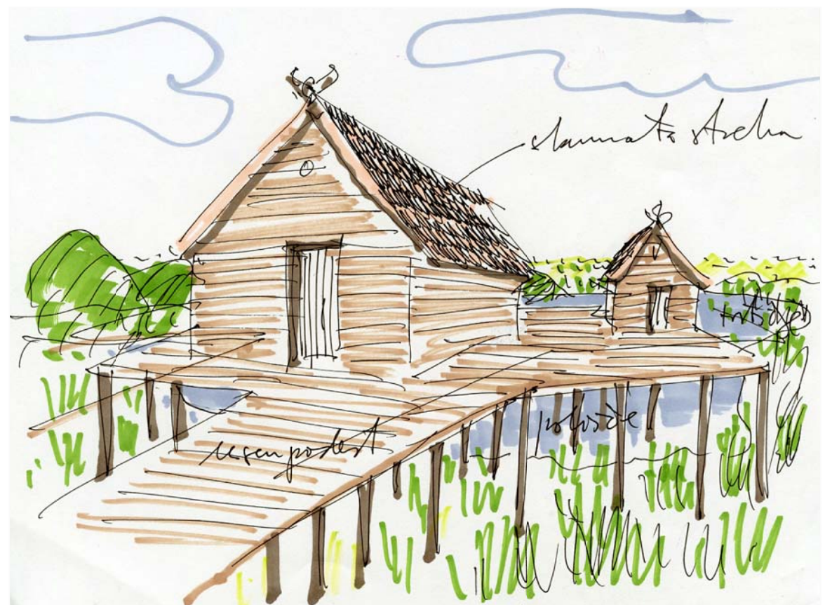
Pogled na leseno ploščad

TEMATSKI INTERPRETACIJSKI CENTER NA LOKACIJI V CENTRU IGA V NAVEZAVI Z LOKACIJO NA OBMOČJU MED CESTO IG-ŠKOFIJA IN IŠČICO