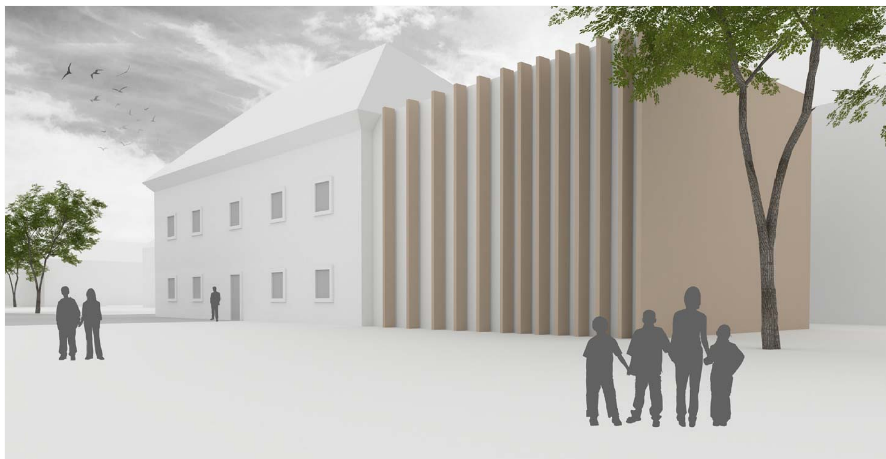
Pogled na objekt iz zadnje strani

TEMATSKI INTERPRETACIJSKI CENTER NA LOKACIJI V CENTRU IGA V NAVEZAVI Z LOKACIJO NA OBMOČJU MED CESTO IG-ŠKOFLJICA IN IŠČICO