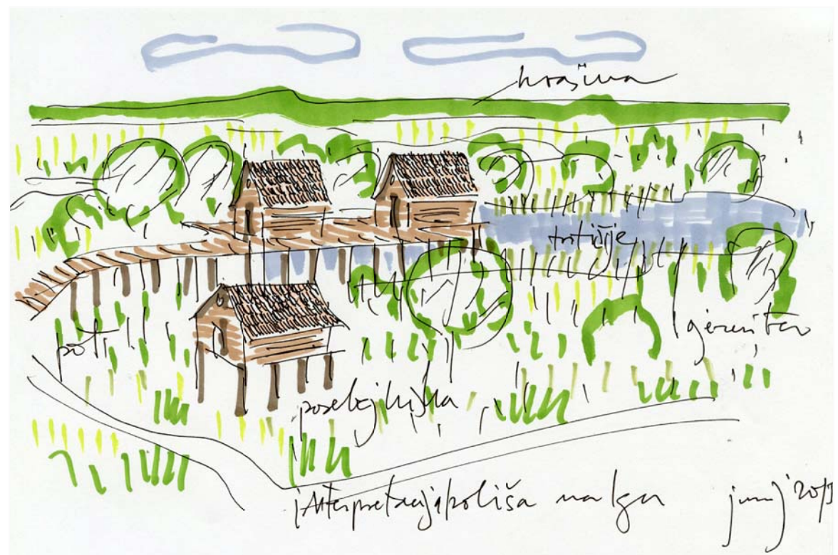
Skica koliščarske naselbine z ojezeritvjo