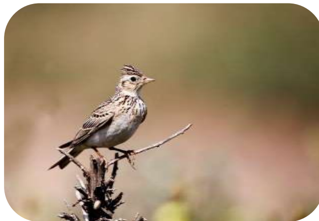
Zaplate golih tal za poljskega škrjanca