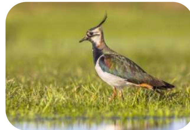
Varstvo gnezd pribe